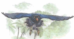
保育鳥類郵票 — 臺灣藍鵲 首日封 Conservation of Birds Postage Stamps — Taiwan Blue Magpie F.D.C.

台灣藍鵲屬鴉科，為台灣特有種保育鳥類，其形態特徵為頭至胸部黑色，嘴喙與雙腳紅色，其餘部分大致為藍色，尾羽甚長。由於羽色華麗，常受獵人覬覦，更因環境過度開發與汙染而面臨嚴重的生存壓力。為喚醒人們對生態保育的重視，特委請台灣大學袁孝維教授規劃〔保育鳥類郵票—台灣藍鵲〕1組4枚及小全張1張。茲將本組郵票圖案簡介如下：