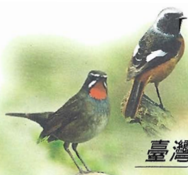
臺灣鳥類郵票 (第1輯) 首日封

Birds of Taiwan Postage Stamps (I) F.D.C.